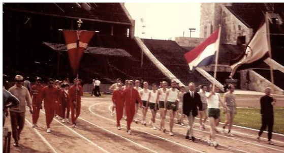
binnenkomst van onze ploeg

District Noord van de KNAU tegen Team uit Odense Denemarken en Team uit West-Berlijn