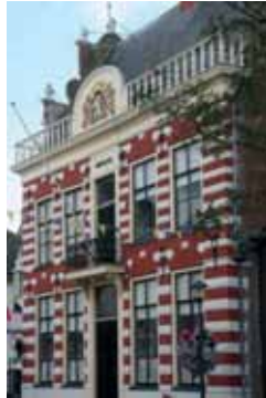
het prachtige oude Hanze-stadje Hattem,