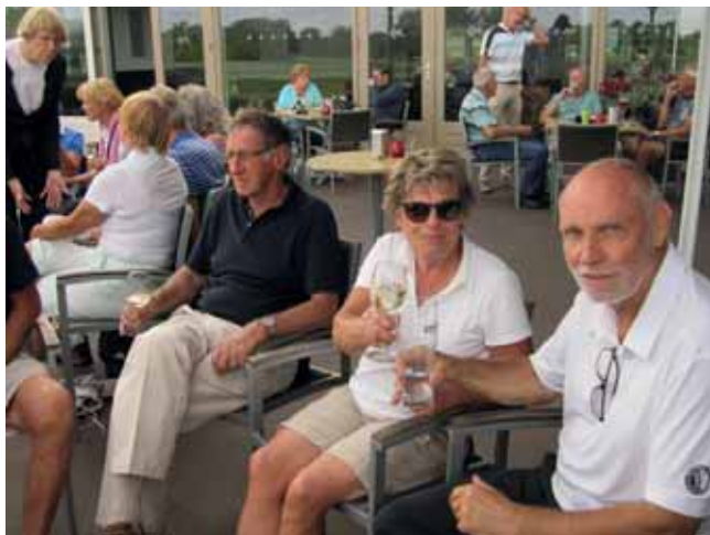
Niet alleen op, maar ook naast de Heemskerkse golfbaan was het goed toeven.