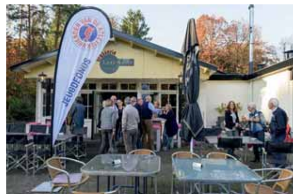
Plaats van handeling: Brasserie Laag Kanje in Maarn.

- De algemene ledenvergadering, gecombineerd met een reünie, vond plaats op zaterdag