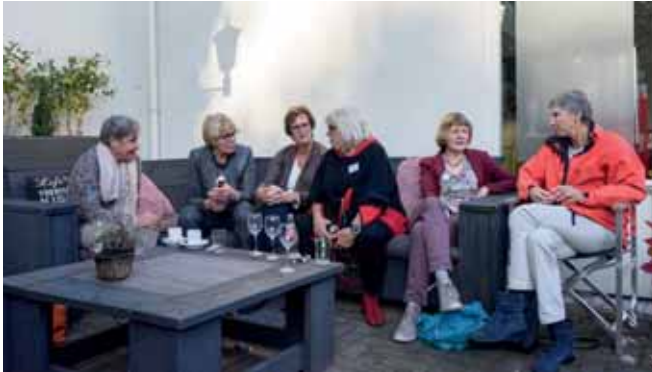
Het elkaar ontmoeten blijft de belangrijkste doelstelling van de reünie.

Ik kom dan ook met een oproep om deze activiteit weer wat nieuw (of is het oud) leven in