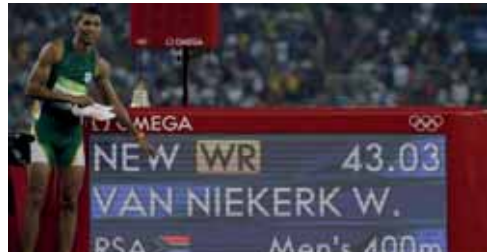
Wayde van Niekerk staat trots naast het bord met zijn nieuwe wereldrecord.

Op 21 augustus liep de Zuid-Afrikaan Wayde van Niekerk daar in de buitenbaan een onwaarschijnlijke race, een race van buitenaards niveau. Na supersnel te zijn gestart, gebeurde niet waarop ik zat te wachten: de ineenstorting in de tweede bocht. Integendeel, Van Niekerk ging harder en harder, leek op het laatste stuk zelfs nog te versnellen en finishte met een straatlengte voorsprong in een fantastische 43,03 sec. Een schitterend wereldrecord, zelfs nog 0,15 sec. sneller dan dat ook al onaantastbaar geachte record van Michael Johnson uit 1999. Voor mij een onbegrijpelijk goede prestatie.