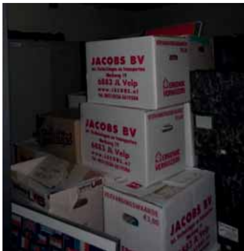
Dozen, dozen, tot aan het plafond

Het inruimen kon nu beginnen; en wat ons hierbij opbrak is, dat we met het verhuizen ook de organisatie meteen wat wilden aanpassen. Het werd dan ook een tragere start door het in een keer zowel aan te passen als ook in te ruimen; niet echt handig, maar spoedig kwam de vaart erin.