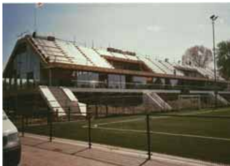
Het clubverzamelgebouw in wording.

TRIBUNE. Het relaas daarover stond in een van de vorige nummers van De Vriendenband. Ook ons voorstel voor een achtlaans baan aan het Langepad met overdekte tribune e.d. werd door de gemeente Rotterdam teruggebracht tot een zeslaans rondbaan met acht sprintlanen, maar ook weer zonder tribune!