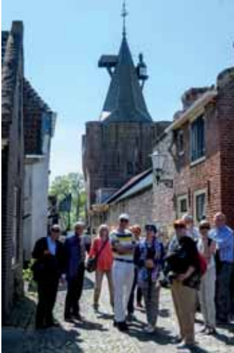
Rondleiding door de sfeervolle straatjes van Elburg.

Om 14:00 uur meerden we aan en in twee groepen werd een rondleiding door Elburg gedaan. Onder leiding van twee enthousiaste en deskundige gidsen, die zelf levenslang in Elburg hebben gewoond, werden de nauwe, maar zeer sfeervolle straatjes doorkruist. Elburg heeft als Hanzestadje veel historische pandjes en heel veel bezienswaardige plekken. Het is zeker de moeite waard om dit plaatsje te bezoeken.