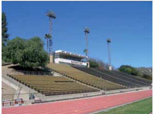
Het Hilmer Lodge Stadium in Walnut.