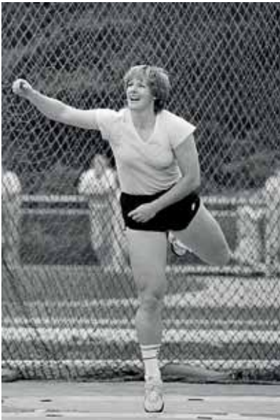
Ria Stalman in 1982.

In ons land spreken de media graag over de ‘magische’ grens van 60 meter, wanneer het discusswerpen bij de vrouwen ter sprake komt. Ook al gooit tweevoudig Olympisch kampioene Sandra Perković de discus al jaren voorbij de 70 meter en kwam de Kroatische vorige maand in Doha nog tot 71,38 m. Inmiddels noteerde de wereldranglijst eind vorige maand maar liefst 72 vrouwen met een worp voorbij de 60 meter. Gelukkig is daar voor het eerst sinds jaren ook weer eens een Nederlandse bij, Corinne Nugter, die op 17 mei in Heerhugowaard de discus op een afstand van 60,02 m neerlegde.