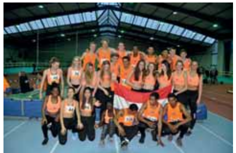
De Nederlandse ploeg van het Indoor Event in Munster in 2019.

Een bewijs dat zelf ook wedstrijden georganiseerd konden worden is geleverd door het opzetten van het Internationale Indoor Event voor atleten onder de 17 jaar. Na een voorzichtige start in Zoetermeer werden er succesvolle semi-interlands