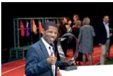
Een blije Haile Gebrselassie met zijn Award.

“Het reliëf van de aarde/landen symboliseert de prestatie op een wereldniveau. Ook weergeeft het de verbinding (band) van mensen, verschillende landen, culturen en geloven door topsport. Bij deze band zijn de uiteinden verbonden door deze een halve slag te verdraaien. Hierdoor ontstaat een zijde die oneindig is. Deze bandvorm kun je dan ook zien als een loopbaan/levenstraject, een weg van uitersten, vastberadenheid gebundeld in een doel. Hiermee draagt het object wijsheid en concentratie met zich mee. Het oneindige in de vorm geeft de discipline weer (trainings-frequentie), maar vooral de onuitwisbare nalatenschap van geleverde prestatie (wereldtitels). De vormovergang van binnen- naar buitenzijde bespiegelt de verandering van internationale topsporter naar een loopbaan als landsvertegenwoordiger.”