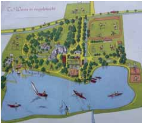
Te Werve in vogelvlucht.

Een betonnen discusschijf bij de cornerstip op het veld dat we deelden met de voetballers, een middelmatige voorziening voor hoog- en verspringen en kogelstoten, dat was het wel.