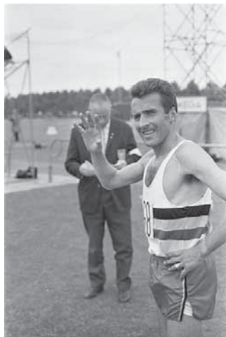
Gaston Roelants.

U begrijpt al waar ik heen wil, want naast een klare organisatie en een pronkende prijzentafel met allerhande boedel, bijeengebracht door plaatselijke sympathisanten en nijveraars, werd er in een Vlaams jargon gekeuveld. Dit droeg bij aan de goesting die ik voor deze ruige sport koesterde.