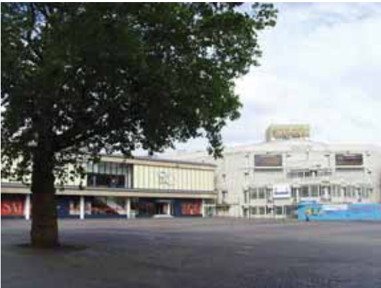
Deel van het Vredenburg, waar op 13 juli 2017 het NK-onderdeel polsstokhoogspringen plaatsvindt.

Wedstrijdinformatie is te vinden via de website .