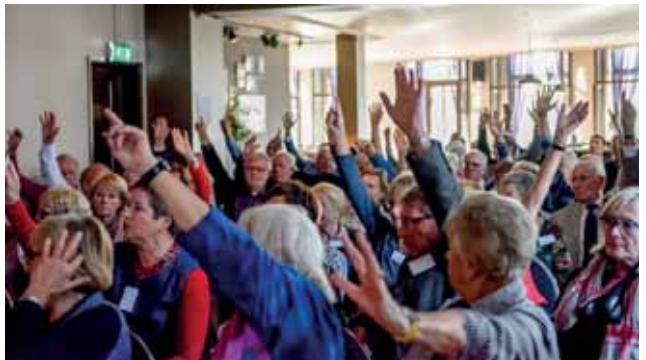
In de ALV van 2014 gingen de handen massaal omhoog bij het voorstel om de ledencontributie te verhogen ten bate van het Jeugdfonds.

De keuze is gemaakt om de komende vijf jaar €6000,- aan talentvolle atleten te besteden en €4500,- aan internationale jeugdwedstrijden.