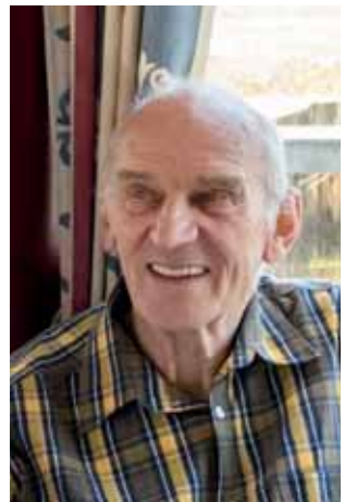
Henk Snepvangers, gefotografeerd tijdens de reünie in Elburg, afgelopen voorjaar.

In 1962 zette ik, na al tijdens mijn HBS-opleiding kennis te hebben gemaakt met de atletieksport, als lid van een atletiekclub mijn eerste aarzelende hardlooppassen op een sintelbaan. Een jaar eerder werd Henk Snepvangers voor het eerst Nederlands kampioen op de 1500 m en u kunt zich voorstellen, dat in de ogen van een achttienjarige, beginnende atleet Snepvangers in die tijd een onbereikbare grootheid was, een atleet van wiens prestaties ik slechts kon dromen. Aangezien hij in de jaren die volgden tot en met 1967 de 1500 metertitels aan elkaar reeg, werd dat beeld alleen maar bevestigd. Daar kwam bij dat mijn vorderingen op het gebied van de middellange afstand voor mijzelf weliswaar noemenswaard waren, maar mijlenver uit de buurt bleven van de 3.42,2 die Snepvangers in 1966 als Nederlands record in de boeken liet optekenen. Kortom, Snepvangers bleef voor mij de halfgod op hardloopgebied, zoals ik hem sinds 1961 was gaan zien.