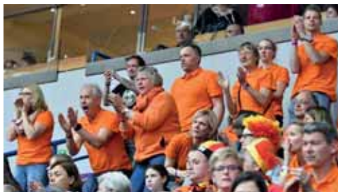
Oranje supporters in speciaal gereserveerde vakken op alle belangrijke internationale wedstrijden, dat is het doel waarnaar wij streven.