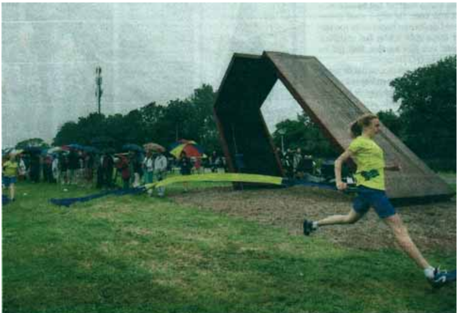
Jonge meiden van AV Lionitas lopen een 200 meter-parcours langs het monument voor Foekje Dillema.

Hier betref het een stukje van Willem Bosma met foto. Ons voormalige lid Geesje Jorna sprak bij de onthulling van het monument. Het werd ontworpen door Ids Willemsma. De symboliek schuilt in de duidelijk te herkennen hardloopenbenen. Het werd geplaatst bij de ingang van de baan van AV Lionitas in Leeuwarden. Op die plek begon Dillema bij het toenmalige Vitesse.