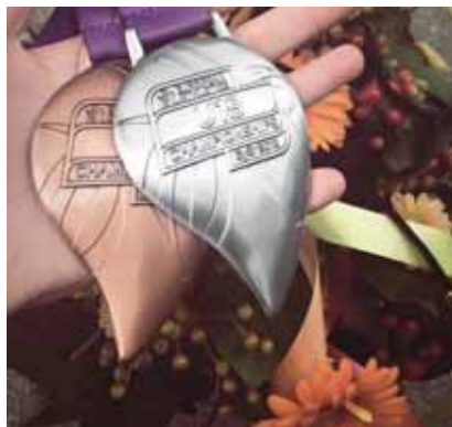
De medailles van Györ van Alida van Daalen.

De finales (kogelstoten en discuswerpen) waren zwaarder dan ik vooraf had verwacht, omdat ik te graag ver wilde werpen en stoten en als je te gretig bent met werpen, dan raak je de kogel en of discus niet. Ik moest tweemaal van een 4 de plaats proberen de top 3 te halen. Maar uiteindelijk hing er een bronzen en een zilveren medaille om mijn nek en was