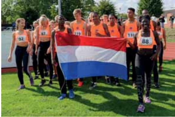
Opmars van de Nederlandse ploeg voor de C-interland in Münster op 1 september jl; een belangrijke springplank in het opdoen van internationale ervaring.

van internationale evenementen en op het geven van een internationaler karakter aan de grotere landelijke jeugd-evenementen.