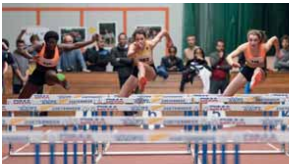
Jeugdig talent in actie op de 60 m horden tijdens de interland voor C-junioren in Zoetermeer

Zo konden onze jeugdathleten ervaren wat een internationaal toernooi zou betekenen. Het jeugdfonds stelde gelden beschikbaar en expertise, aangevuld met bestuursleden van de