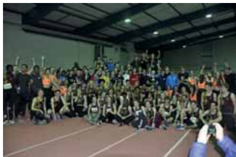
Sport verbreedert, zo bleek ook in Münster: alle teams op één foto.

In 2018 is in de mooie indoorhal bij Ilion in Zoetermeer een nieuw project gestart: een internationale indoor-ontmoeting tussen België (Vlaanderen), Duitsland (Nordrhein Westfalen) en Nederland voor atleten onder de 17 jaar. Doel hiervan was om atleten aan de overgang van C- naar B-junioren en de daarmee gepaard gaande wijzigingen in gewichten (kogel) en afstanden (horden) te laten wennen. Deze wedstrijd in Zoetermeer bleek een schot in de roos, ook bij onze Zuider- en Oosterburen en besloten werd om dit