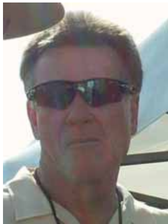
Olympisch kampioen 1968 Bob Seagren in 2012.