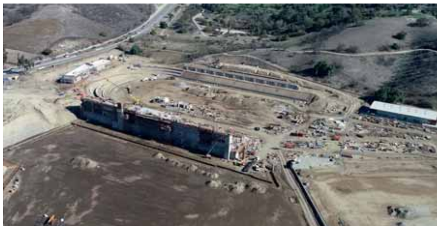
Overzichtsfoto van de stand van zaken rond de verbouwing van het Hilmer Lodge Stadium in Walnut eind vorig jaar.