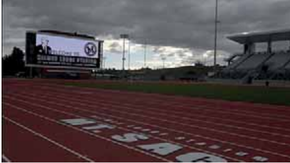
De compleet gerenoveerde baan van Mount SAC.

Vorig jaar meldde onze Amerikaanse vriend Ray van Asten dat het Hilmer Lodge Stadium, de atletiekbaan in het Californische Walnut van Mount San Antonio College, de