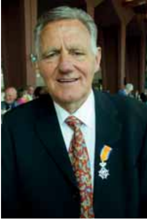
Egbert Nijstad, nadat hij in 2014 koninklijk was onderscheiden.

Het kwam in ons blad al eerder aan de orde, namelijk toen hij in 2014 een lintje kreeg: Egbert Nijstad was in het begin van de jaren zeventig het uithangbord van de Nederlandse atletiek, in elk geval op loopgebied. In zes jaar tijd, te beginnen in 1969, had hij alles bij elkaar niet minder dan zeventien nationale titels veroverd op zes verschillende onderdelen, van de 1500 m tot en met de 3000 m steeple en het veldlopen aan toe. Bovendien had hij negen nationale records gevestigd.