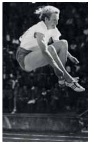
Fanny Blankers-Koen in actie bij het verspringen tijdens de vijfkamp in Bern. Ze kwam daar bij die gelegenheid tot 5,80 m.

Fanny had dan weliswaar op de EK in Brussel, toen puntje bij paaltje kwam, de voorkeur gegeven aan haar traditionele nummers (100 en 200 m, 80 m horden en de 4 x 100 m estafette) en daarmee driemaal goud en eenmaal zilver gescoord, toch wilde zij de wereld laten zien dat zij ook op de vijfkamp tot de top behoorde. Dus toog zij een jaar later naar het Zwitserse Bern, waar zij op 25 en 26 augustus deelnam aan een internationale vijfkamp. Die meerkamp bestond toen uit: kogelstoten, 200 m, hoogspringen, 80 m horden en verspringen. Volgens AW-verslaggever Nic. Lemmens werd het voor Fanny Blankers-Koen een walkover, want ze won met een puntentotaal van 4185, bijna 1050 (!) punten meer dan haar meest directe tegenstandster. Een nieuw wereldrecord, meldde Lemmens, al maakte hij nog enig voorbehoud vanwege de prestaties van een Russin, die 4225 zou hebben verzameld, een record dat –nog– niet was erkend. Ook de dagbladen besteedden aandacht aan Fanny’s wereldrecordprestatie. Toch is deze niet terug te vinden in de recordoverzichten van de