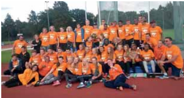
Prachtig vinden wij die U16- en U17-interlands. Maar is de Atletiekunie dat met ons eens?

goed overleg te bepalen hoe wij ons steentje – hoe klein deze ook is – kunnen bijdragen. En dat overleg moet plaatsvinden met specialisten van de AU. Soms krijg ik een beetje het gevoel dat wij elkaar beconcurreren: de semi-interlands U16 en U17 vinden wij prachtig, maar vindt de AU dit ook? Toch vind ik dat wij er sterk aan moeten gaan werken om de tegenstrijdige gevoelens weg