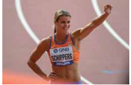
Dafne Schippers, WK 2019.

Utrecht 20200830 (ANP) - Dafne Schippers sukkelte met rugklachten. De Utrechtse sprintster lag vier dagen plat na haar eerste wedstrijd op de 200 meter eerder deze maand in Hongarije en kreeg opnieuw een stijve rug na de series van de 200 meter zondag op de NK atletiek in Utrecht. Ze meldde zich uit voorzorg af voor de finale. "Ik voel me best wel goed, maar loop wel een beetje met een rugblessure" , zei ze tegen de NOS. "Ik wil absoluut geen risico's nemen. Er komen nog best veel wedstrijden aan en ik wil investeren in de toekomst. Twee races in anderhalf uur was te veel voor nu."