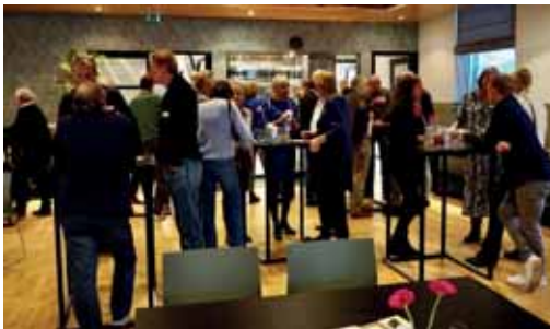
Al vroeg een gekakel van jewelste.

Toen de inschrijving was gesloten hadden 115 deelnemers ingeschreven. Zelfs Vrienden