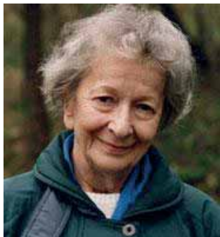
Wislawa Szymborska