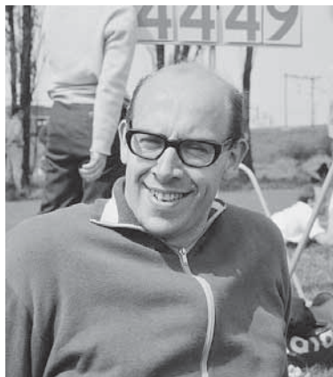
Cees Koch in 1964.

Cornelis Koch, geboren in 1936 in Rotterdam, was vanaf midden jaren vijftig tot midden jaren zestig in Nederland de te kloppen atleet op het gebied van discuswerpen en kogelstoten. Beide werpnummers tilde hij in Nederland naar een hoger niveau. Met de kogel was hij de eerste in ons land die de 16 meter bedwong; in twee jaar tijd legde hij het nationale recordniveau in vijf stappen bijna een meter hoger. De discus wierp hij als eerste Nederlander voorbij de 50 meter en verbeterde vervolgens in negen stappen zijn record van 50,07 meter in 1956 naar 58,05 m in 1962. In totaal werd Cees Koch tussen 1955 en 1965 op beide werpnummers vijftien maal Nederlands kampioen. Hoe sterk hij met name als discuswerper was, moge blijken uit het feit dat, toen Koch in 1970 bij wijze van grap nog eens aan de Nederlandse baankampioenschappen deelnam, hij prompt opnieuw kampioen werd, hoewel hij gedurende vijf jaar al niet meer regelmatig had getraind en sinds 1965 voorrang had gegeven aan zijn maatschappelijke carrière. Het werd zijn zestiende en laatste nationale titel.