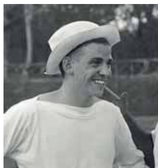
Armin Hary in 1960.

Het jaar daarvoor had Visser zich in de Verenigde Staten gevestigd. Met de Duitse sprinter Armin Hary (later in Rome winnaar van de 100 meter) had hij een studiebeurs van het Bakersfield College bemachtigd. Die stelde Visser in staat bij aangename temperaturen te sporten. Nederland was hem te koud en te klein. Het ging hem goed af in Amerika. Visser sprong in Texas zelfs 8,05, maar die prestatie werd ongeldig verklaard.