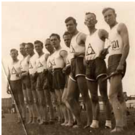
De 10 x 100 meterploeg van AV'23.

Van Beveren zorgde in 1936 voor de beste olympische prestatie van een AV'23-er. In de finale van de 200 meter eindigde hij als zesde (21,9). Wijnand van Beveren, zoals hij officieel op de startlijsten wordt genoemd, liep vier keer. Winnaar van de eerste serie (21,4), winnaar van de kwartfinale (21,7), derde in de halve eindstrijd (21,5). Het goud was voor de Amerikaan Jesse Owens, de held van die Spelen.